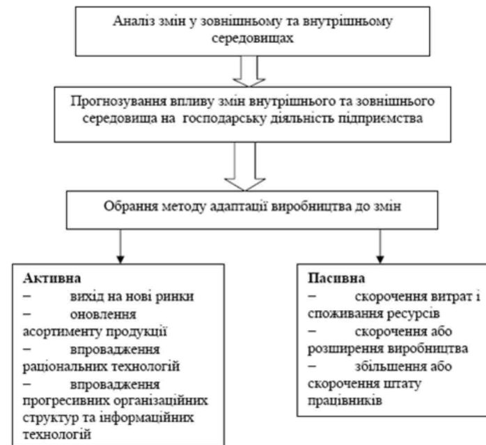
Рис. 3. Механізм адаптації діяльності підприємства до змін у зовнішньому та внутрішньому середовищах

Вчасне реагування підприємства до зовнішніх та внутрішніх змін дає змогу зберегти свої позиції на ринку та бути конкурентоспроможними.