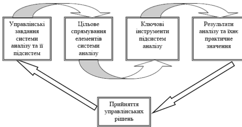
Рис. 1. Механізм взаємозв'язку етапів функціонування системи аналізу в управлінні підприємством (розроблено автором)

На рис. 1 представлено механізм взаємозв'язку етапів функціонування системи аналізу в управлінні підприємством.