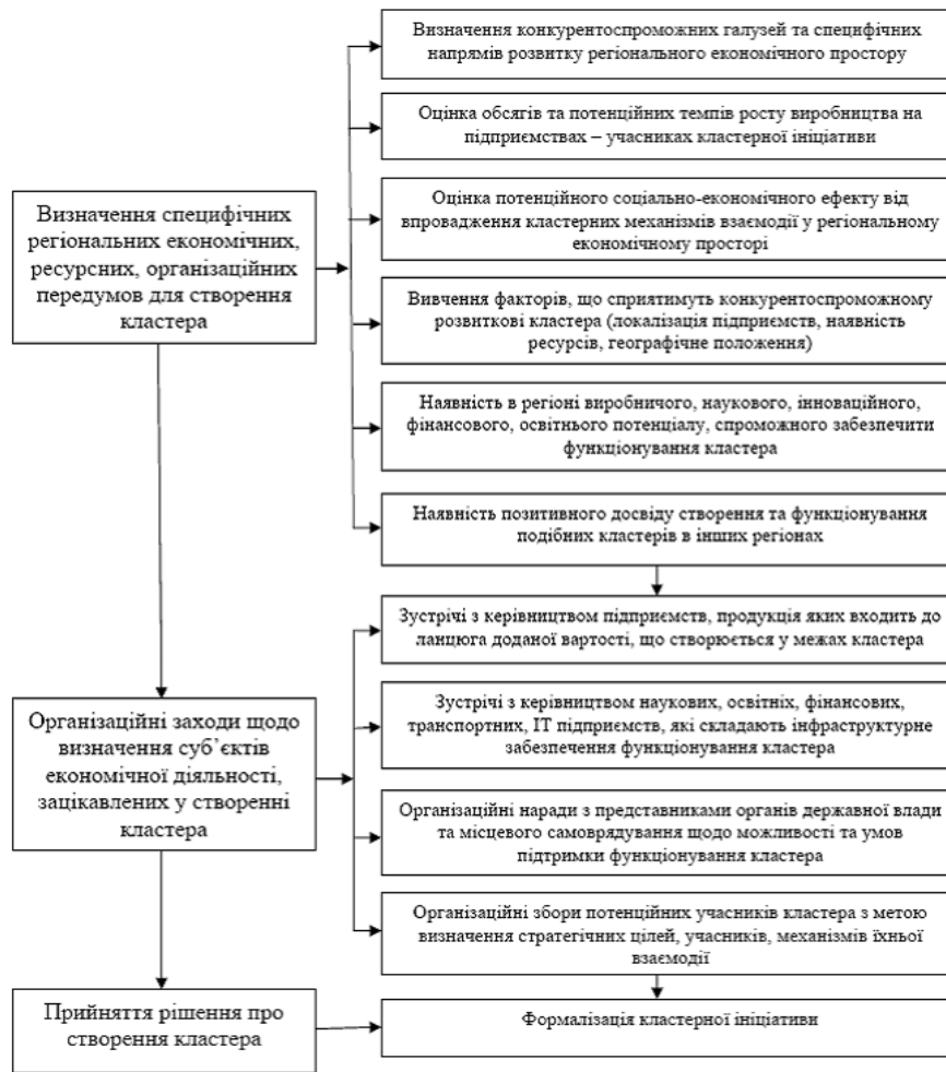
Рис. 2. Модель ідентифікації кластера «знизу догори»

Кластери, що ідентифікуються у відповідності до моделі «знизу догори», в контексті детермінант внутрішньої структури, являють собою постіндустріальні, горизонтально інтегровані, кон'югаційні системи на основі комбінації конкуренції з потенційною координацією діяльності і транзакційними зв'язками, високим рівнем інноваційності, вони формуються, як правило, спонтанно без участі органів влади, на основі активного використання інформаційно-комунікаційних технологій, зокрема, віртуального середовища Інтернет (віртуальні кластери, технології краудсорсингу, краудфандінгу, краудстронінгу, краудвиробництва), або за організаційного впливу управлінських структур мережевої взаємодії (Координаційна рада з питань стратегічного розвитку).