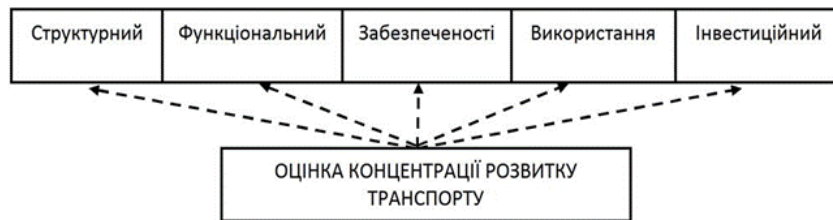
Рис. 3. Критерії регіональної концентрації розвитку транспорту* * Розроблено автором

Висновки. Таким чином, можна стверджувати, що прояви асиметрії соціально-економічних процесів є однією з ознак, що може відображати особливості процесів соціально-економічного розвитку. Тому, у роботі було здійснено уточнення видів асиметрії та запропоновано систему показників її оцінки.