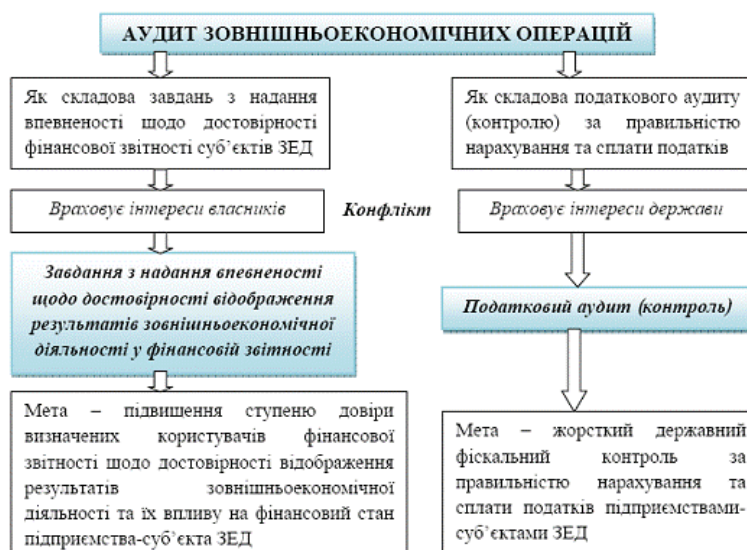
Рис. 1. Аудит зовнішньоекономічних операцій як складова різних видів фінансового контролю

Ключовою відмінністю цих двох видів фінансового контролю є врахування різних інтересів, які не завжди співпадають. Тому і пріоритетні напрями аудиту зовнішньоекономічних операцій будуть залежити від мети здійснення перевірки.