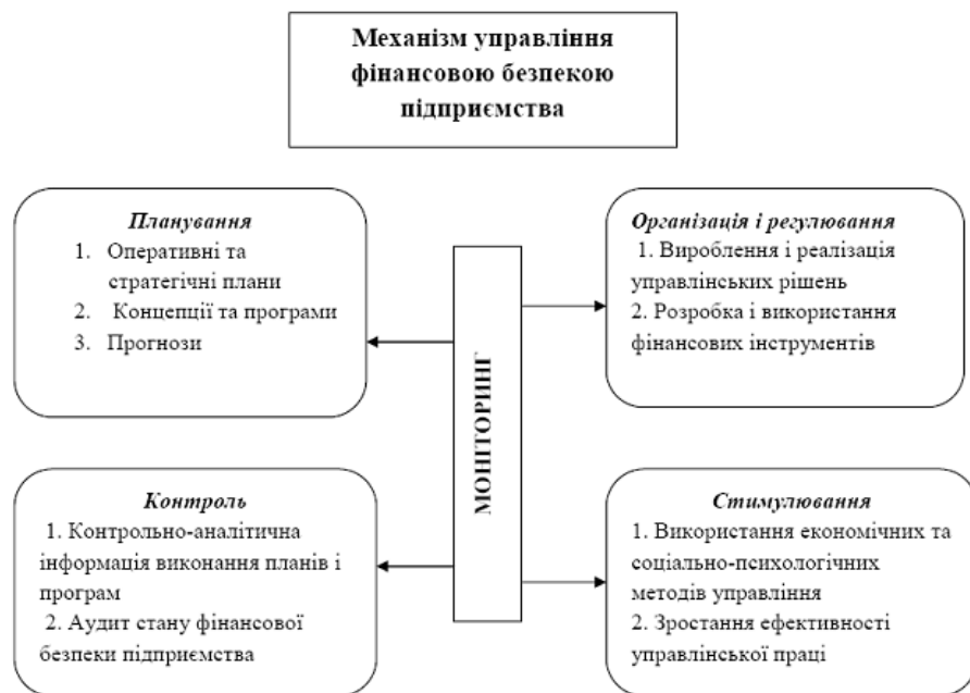
Рис. 1. Функціональна структура механізму управління фінансовою безпекою підприємства

Важливим аспектом дослідження механізму управління фінансовою безпекою підприємства є аналіз функцій, які реалізовує цей механізм. До складу основних функцій механізму управління фінансовою безпекою підприємства можна віднести планування (програмування і прогнозування), організацію і регулювання, стимулювання і контроль [6] (рис. 1).