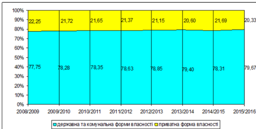
Рис. 2. Зміна питомої ваги ВНЗ різних форм власності в Україні [3]