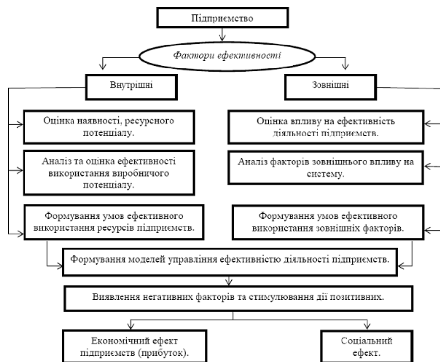
Рис. 2. Механізм реалізації шляхів підвищення ефективності діяльності підприємств спиртової промисловості

Досягнення високих результатів господарювання підприємств можливе завдяки виявленню та нейтралізації негативних факторів та стимулюванню дії позитивних, зокрема удосконалення організаційної структури, збалансування виробничого потенціалу, впровадження нових технологій. Реалізація внутрішніх і зовнішніх факторів підвищення ефективності діяльності підприємств забезпечить отримання не лише економічного ефекту, але й соціального (рис.2).