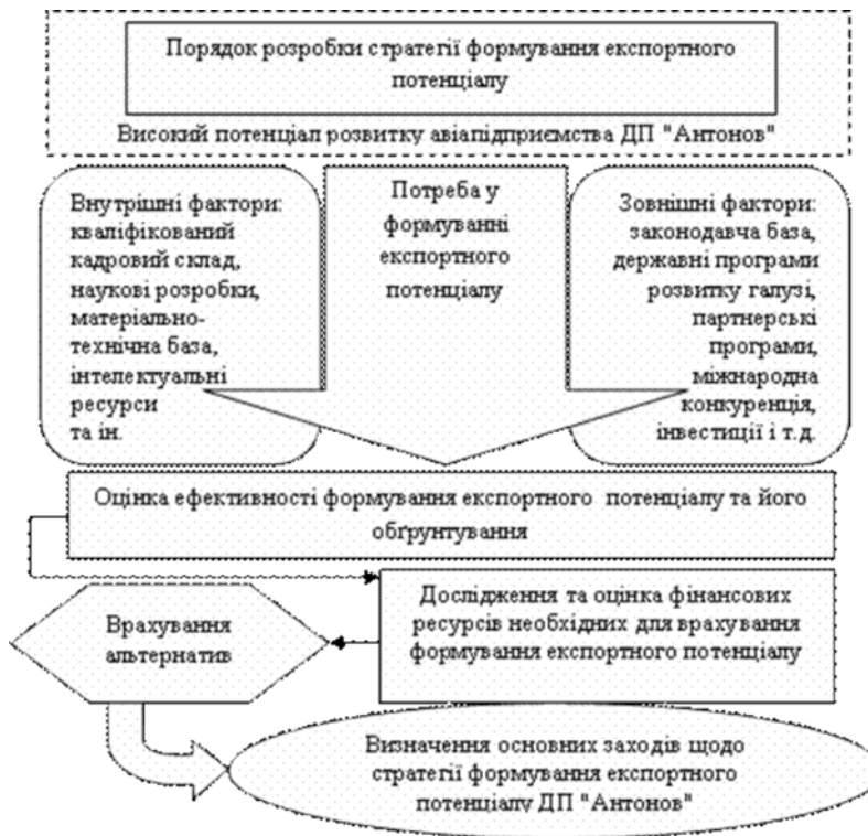
Рис. 1. Етапи розробки стратегії формування експортного потенціалу ДП "Антонов" (Розроблено автором)

Перший етап - це етап планування, на якому передбачено процес визначення потреби у експортному потенціалі підприємства, відбувається оцінка в наявного потенціалу та можливостей для формування майбутнього з урахування зовнішніх та внутрішніх факторів.