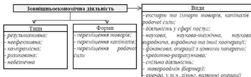
Рис. 1. Класифікаційні ознаки дефініції «зовнішньоекономічна діяльність» за Л. Пісьмаченко [23, с. 74]

Відмінне від зазначених вище визначень, трактує категорію «зовнішньоекономічна діяльність» Л. Пісьмаченко [23, с. 74], стверджуючи, що «поняття зовнішньоекономічна діяльність є складною агрегованою економічною категорією, яка складається з окремих елементів і класифікується за типами, формами та видами» (рис.1).