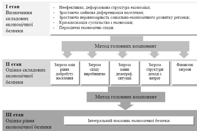
Рис. 2. Поетапна схема процедури оцінки рівня економічної безпеки

Отже, на основі перерахованих критеріїв рівня загроз економічній безпеці за складовими було оцінено загальний рівень економічної безпеки за допомогою методу головних компонент. Спершу обраним методом було оцінено рівень безпеки за кожним з перелічених п'яти напрямів поквартально з 2002 до 2015 років, згодом було об'єднано отримані оцінки для визначення загального інтегрального показника рівня економічної безпеки країни у зазначений період. Дану процедуру описано схематично на рис. 2.