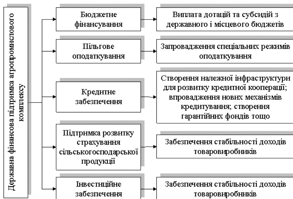
Рис.1. Державна фінансова підтримка агропромислового комплексу України

Водночас, вплив держави на розвиток агропромислового комплексу характеризується недосконалістю, необґрунтованістю та недостатністю фінансування, що потребує перегляду форм і методів його державної підтримки. Відтак, наявне збільшення обсягів державної фінансової підтримки не стимулює товаровиробників до зростання обсягів та ефективності виробництва сільськогосподарської продукції. Тому фінансова підтримка повинна орієнтуватися на стимулювання аграрного виробництва і надаватися, перш за все, товаровиробникам, які забезпечують ефективне використання наявних ресурсів.