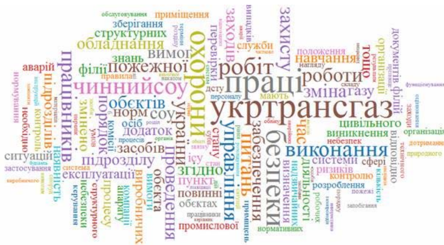
Рисунок 1. Графічна інтерпретація результатів контент-аналізу нормативних документів у сфері управління людським капіталом ПАТ «Укртрансгаз»

ресурсами підприємств, а саме стандарти організації, інструкції, методики, положення, регламенти, накази тощо. В якості методу дослідження нами було обрано контент-аналіз. Інструментом для проведення дослідження слугувала платформа Paper Machines [1] , яка використовує інструменти бібліографічного он-лайн редактора Zotero [2] . За допомогою програмного комплексу було здійснено контент-аналіз вищеперелічених документів. В якості критеріїв проведеного контент-аналізу було обрано частоту згадування окремих слів та понять у базі даних нормативної документації підприємства. Після проведення ручної верифікації отриманих результатів та виключення окремих часто вживаних слів, які не несуть змістового навантаження (сполучники, займенники, прислівники, чисельники, деякі аббревіатури тощо) нами було отримано перелік з 67 найбільш уживаних слів для випадку ПАТ «Укртрансгаз» та 94 - для ПАТ «Укрнафта». Графічна інтерпретація отриманих результатів дослідження наведена на рисунках 1. та 2. На наступному етапі отримані найбільш уживані поняття було об'єднано в сім основних категорій, а саме «Безпека», «Ієрархія», «Нормування», «Процедури», «Технологія», «Персонал» та «Знання». Результати аналізу наведено в таблиці 1, графічна їх інтерпретація зображена на рисунках 3. та 4.