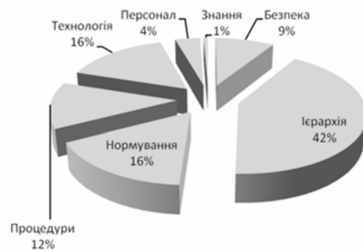
Рисунок 4. Графічна інтерпретація результатів контент-аналізу нормативних документів у сфері управління людським капіталом ПАТ «Укрнафта» у розрізі окремих категорій

Виходячи з результатів проведеного контент-аналізу можна зробити наступні висновки щодо системи управління людськими ресурсами аналізованих підприємств: