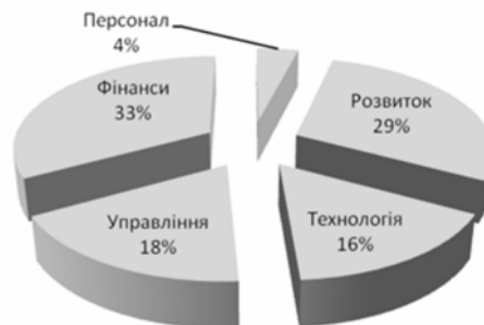
Рисунок 6. Графічна інтерпретація результатів контент-аналізу річних звітів та веб-сторінки фінансово-промислової корпорації «ДТЕК» у розрізі окремих категорій

Вищенаведені результати знову ж таки демонструють спрямованість системи управління корпорації, стратегічна направленість якої зорієнтована на фінансову стійкість та розвиток. Частково отриманий результат може бути пояснений тим фактом, що для аналізу було обрано звітні документи, основне завдання яких являлося продемонструвати надійність та прибутковість компанії потенційним інвесторам. Направленість системи управління демонструють категорії «Управління», «Технологія» та «Персонал». Слід відмітити, що в даному випадку категорія «Управління» увібрала в себе поняття, які у випадку дослідження нормативної документації були віднесені нами до категорій «Процедури», «Норми» та «Ієрархія». Таким чином можна констатувати, що стратегічна складова системи управління людськими ресурсами ПАТ«Нафтогазвидобування» зорієнтована на застосування концепцій «управління трудовими ресурсами» та «управління персоналом».