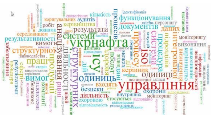
Рисунок 2. Графічна інтерпретація результатів контент-аналізу нормативних документів у сфері управління людським капіталом ПАТ «Укрнафта»