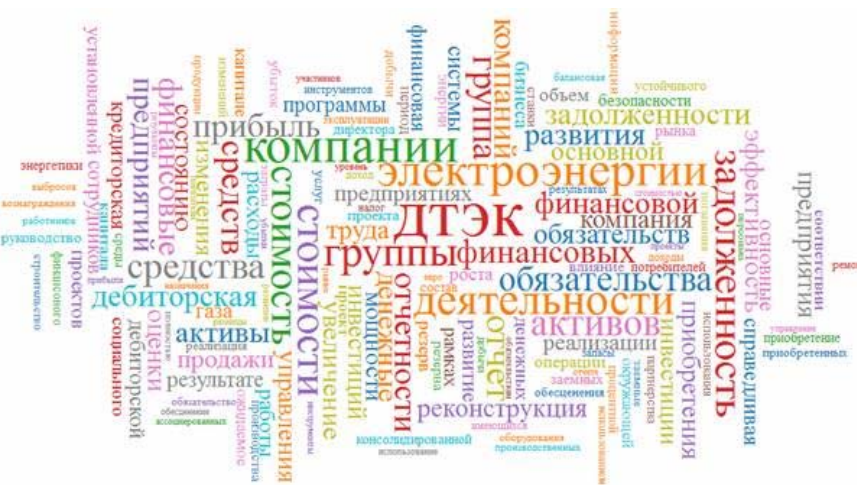
Рисунок 5. Графічна інтерпретація результатів контент-аналізу звітів «ДТЕК» за період з 2010 по 2014 рр.

ПАТ «Нафтогазвидобування», яке являється на сьогоднішній день однією з найуспішніших приватних видобувних компаній, заснування та становлення якої відбулося за часів незалежності України, являється однією з компаній промислово-фінансової групи ДТЕК. На жаль службою внутрішньої безпеки ПАТ «Нафтогазвидобування» було відмовлено надати нам нормативні документи у сфері управління людськими ресурсами, якими послуговується підприємства. З іншої сторони, на відміну від підприємств, які входять до структури НАК «Нафтогаз України», корпорація ДТЕК являється активним учасником програм з корпоративної соціальної відповідальності та сповідує більш відкриту політику у сфері оприлюднення результатів власної діяльності. Зважаючи на те, що ПАТ «Нафтогазвидобування» є складовою ДТЕК, нами було досліджено за допомогою вище описаної методики контент-аналізу річні звіти корпорації, звіти з впровадження корпоративної соціальної відповідальності за період з 2010 по 2014 роки та відповідні розділи офіційної веб-сторінки, що стосуються управління персоналом корпорації (всі проаналізовані документи присутні у вільному доступі [8]). Зважаючи на те, що частина річних звітів опубліковано тільки російською мовою – подальший аналіз проводився російською. Графічна інтерпретація результатів контент-аналізу після верифікації даних приведено на рисунку 5.