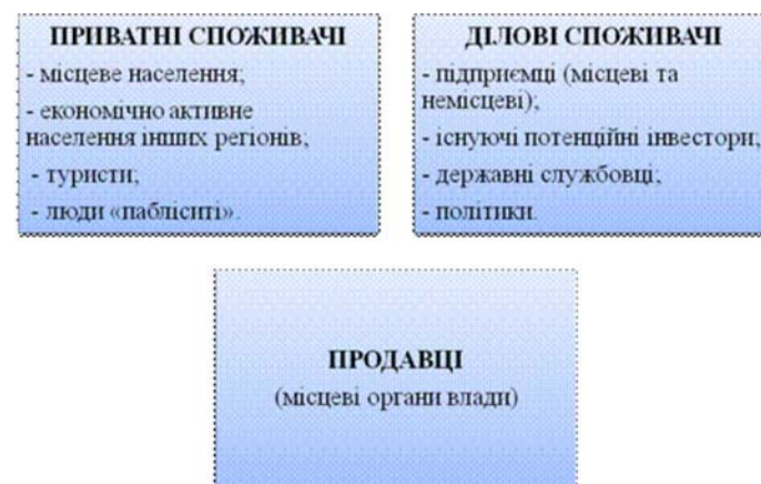
Рис. 1. Продавці та покупці територіального бренду [2]

Саме тому у зовнішньоекономічних стратегіях формування бренду території ключовим аспектом є орієнтація на визначені групи споживачів (рис. 1).