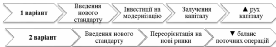
Рис. 2. «Вплив запровадження нових стандартів на баланс поточних операцій та баланс руху капіталу країни-експортера»

варто розглянути й вплив запровадження нових стандартів на її баланс поточних операцій та баланс руху капіталу. Наочно дану картину демонструє рис. 2.