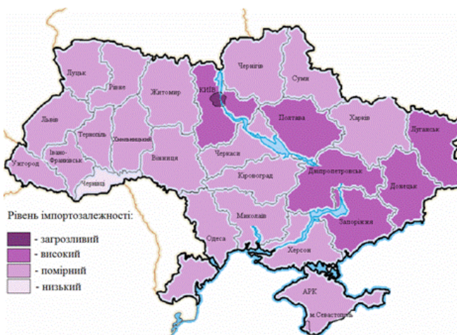
Рис.1. Картографічне зображення імпортозалежності регіонів України

Графічне зображення регіональної імпортозалежності подано на рис.1.