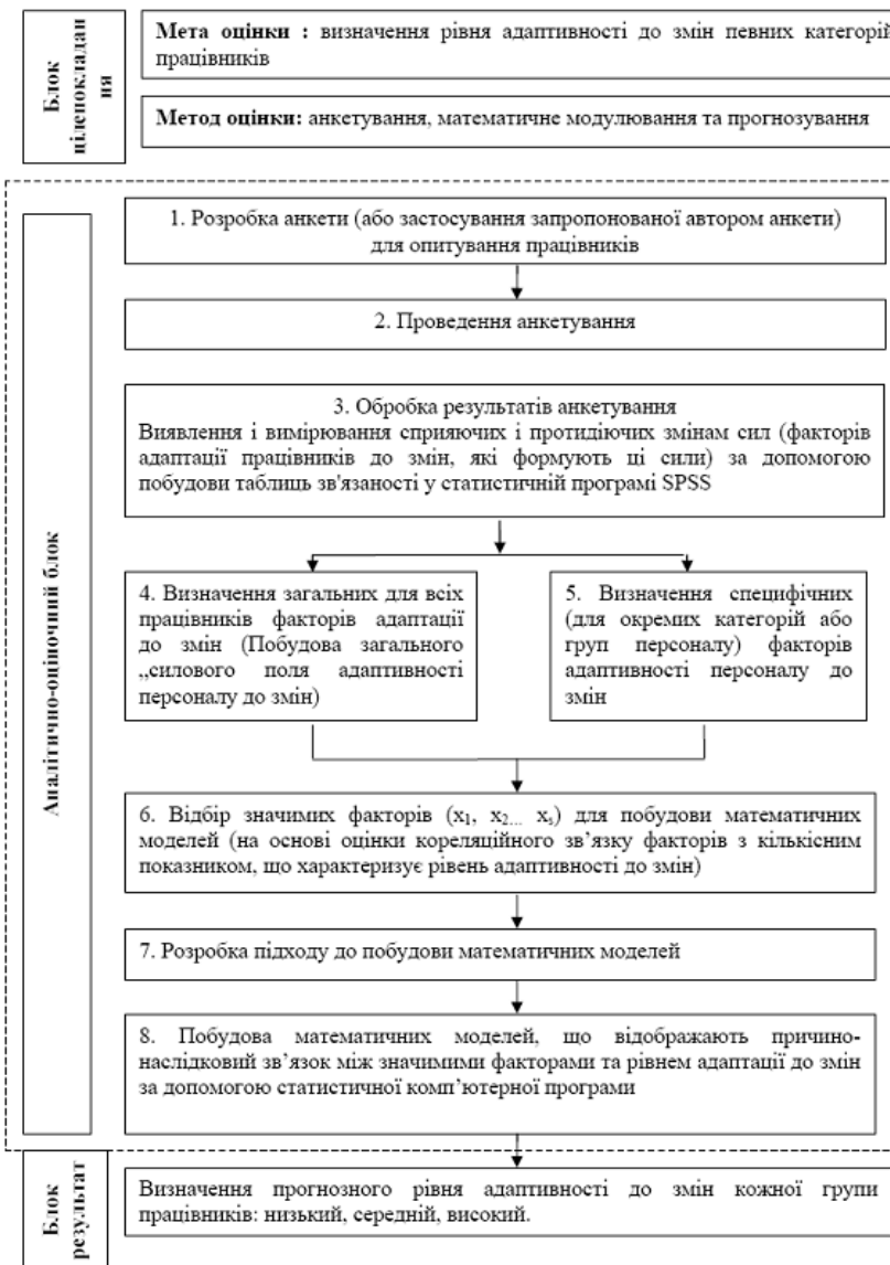
Рис. 2. Методичний підхід до оцінки рівня адаптивності персоналу підприємств до стратегічних змін