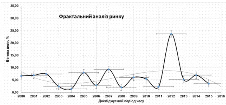
Рис. 2. Діаграма розподілу значень запитів для поняття «фрактальний аналіз ринку»