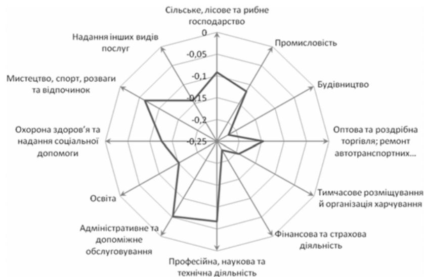
Рис. 3. Відносні значення зменшення кількості підприємств за галузями протягом 2010-2014 рр.

Як бачимо з рис. 2, найбільше від економічної стагнації постраждала галузь оптової та роздрібно торгівлі, найменше – галузь мистецтва, розваг і спорту. Проте більш детальний аналіз потребує розгляду відносних значень зменшення кількості підприємств за галузями (рис. 3). Як бачимо з рис. 3, найбільша частка підприємств закрилась саме у галузі «Адміністративного і допоміжного обслуговування», найменше значення даного показника протягом 2010-2014 рр. характерне для галузі фінансового та страхового обслуговування.