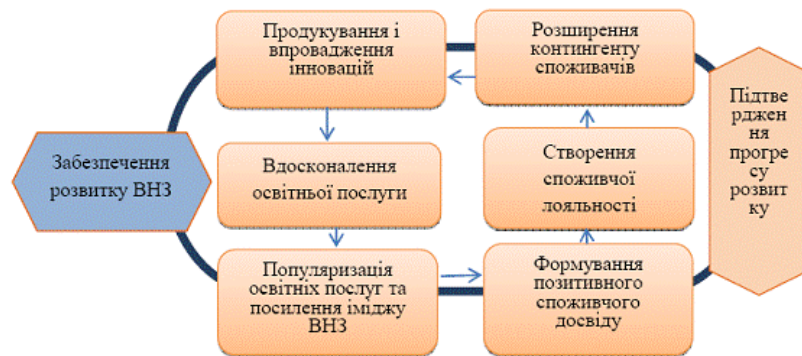
Рис. 2. Схема процесу забезпечення розвитку ВНЗ (розроблено автором)

Важливим для управління ВНЗ як суб'єктом ринку освітніх послуг є забезпечення розвитку в сучасному інформаційному суспільстві (рис. 2). Процес забезпечення розвитку складається з самостійних видів робіт: постійного продукування та впровадження інновацій та вдосконалення освітніх послуг, популяризації освітніх послуг та посилення іміджу ВНЗ, формування позитивного споживчого досвіду та споживчої лояльності, розширення контингенту споживачів. Прогрес в діяльності ВНЗ підтверджує успішність його розвитку.