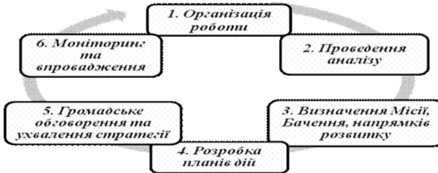
Рис. 1. Основні етапи розробки стратегії розвитку

Виклад основного матеріалу. Важливим та невід'ємним інструментом реалізації стратегії є стратегічний план. Мета Стратегічного плану економічного розвитку малого міста полягає у вирішенні проблем місцевого економічного розвитку та реалізації завдань щодо економічного зростання, підвищення конкурентоспроможності економіки міста, залучення інвестицій на територію міста, якості життя мешканців міста. Стратегічний план спрямований на місцевий економічний розвиток як процес стратегічного партнерства влади, громад та бізнесу, який допомагає прискоренню зростання продуктивності місцевої економіки через стимулювання інвестицій у нові та існуючі підприємства, виробництво найбільшої кількості благ та створення максимальної кількості робочих місць за рахунок реалізації переваг конкурентоспроможності міста у порівнянні з іншими містами та регіонами України. Модель стратегії підбирається й виходить з потреб територіальної громади міста або економічного регіону. Основні етапи розробки стратегії розвитку подано на рис. 1.