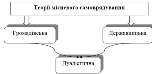
Рис. 1. Класичні теорії місцевого самоврядування