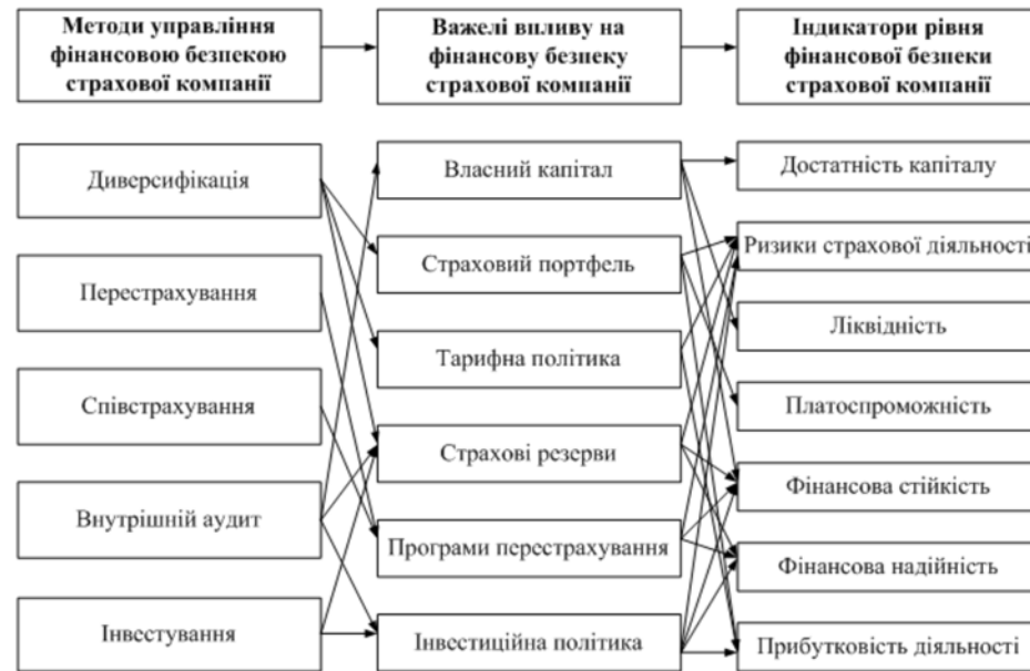
Рис. 1. Структура механізму управління фінансовою безпекою страхової компанії

До основних індикаторів рівня фінансової безпеки страхової компанії належать: достатність капіталу, ризики страхової діяльності, ліквідність, платоспроможність, фінансова стійкість та надійність, а також прибутковість діяльності (рис. 1).