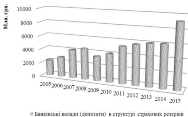
Рис. 4. Динаміка обсягів банківських вкладів, якими представлені технічні резерви та резерви зі страхування життя у 2005-2015 рр.

Як видно з рис. 3, друге та третє місце за часткою у страхових резервах посідають права вимоги до перестраховиків та цінні папери, що емітуються державою. Решта типів активів у структурі страхових резервів має 10% та менше.