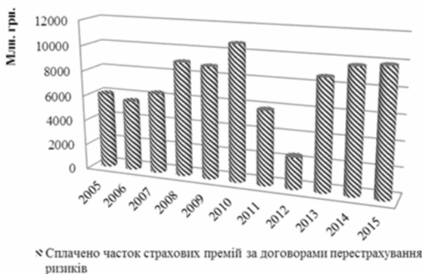
Рис. 5. Сплачено часток страхових премій за договорами перестрахування ризиків

З рис. 5 видно, що не існує стійкої тенденції на ринку перестрахування. Це пояснюється нестабільністю страхового ринку, змінами в економічній кон'юнктурі, зниженням попиту на страхові послуги та іншими факторами. Стабільність ринку перестрахування впливає на рівень попиту та пропозиції на його послуги не тільки на національному, але й на глобальному ринку.