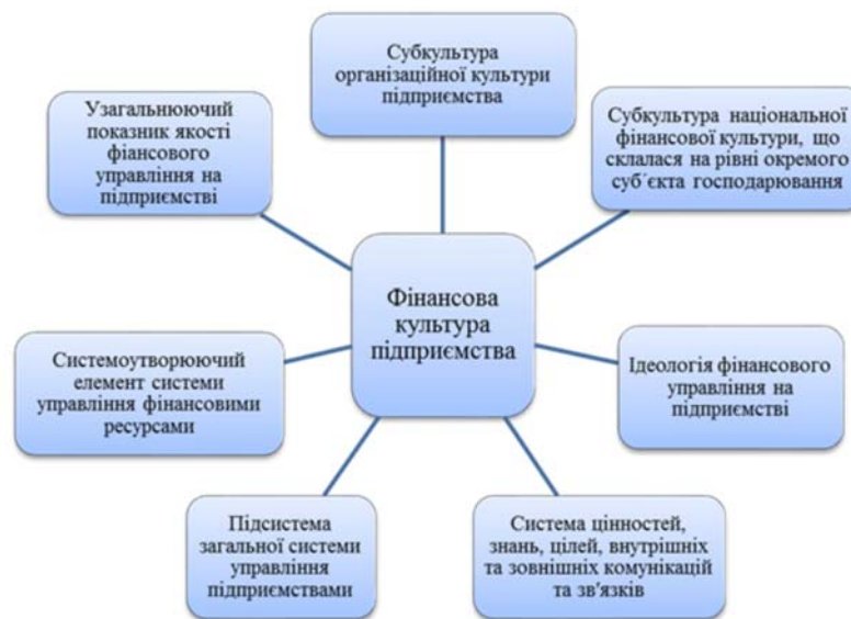
Рис. 1. Підходи до розкриття сутності фінансової культури підприємства

Спираючись на дослідження вказаних авторів, узагальнимо існуючі підходи до розкриття сутності фінансової культури підприємства (рис. 1).