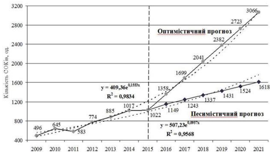
Рис. 3. Динаміка та прогноз кількості сільськогосподарських обслуговуючих кооперативів в Україні до 2021 р. (на початок року)

На рис. 3 зображено песимістичний та оптимістичний прогноз кількості СОКів в Україні до кінця 2020 р.