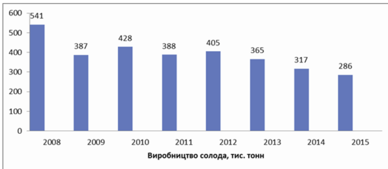
Рис. 2. Обсяги виробництва солоду в Україні у 2008-2015 рр.

Причинами скорочення обсягів реалізації пивоварної продукції стали: