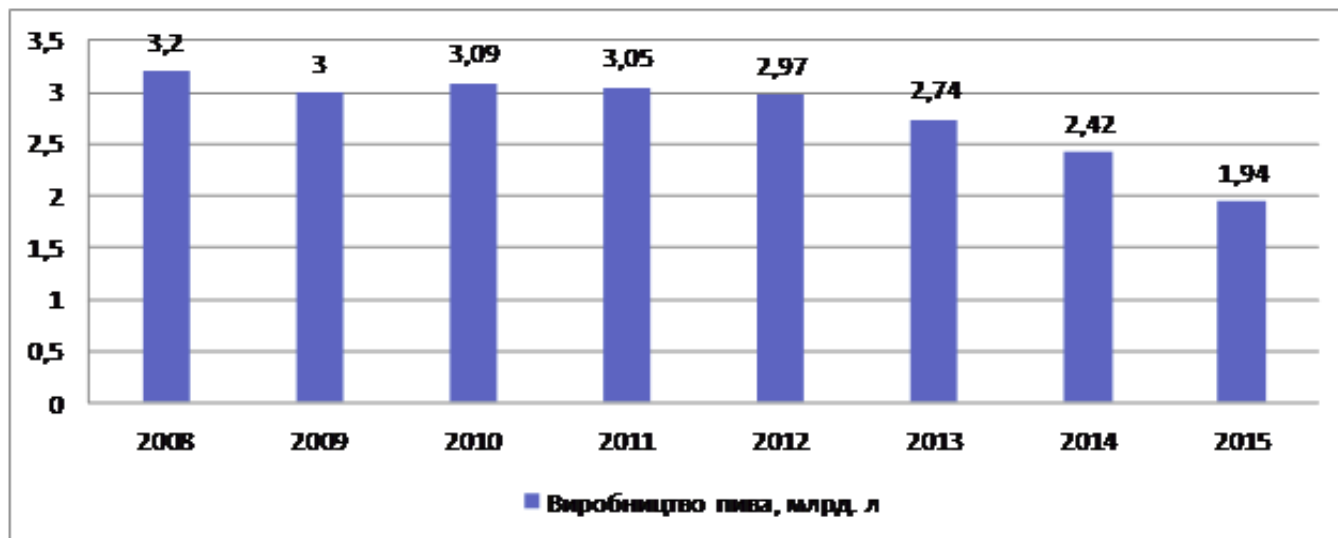
Рис. 1. Обсяги виробництва пива в Україні у 2008-2015 рр.

Виклад основного матеріалу. Проведені дослідження свідчать про те, що пивоварна галузь в Україні перебуває у складному становищі [4]. Так, з 2008 року в пивоварній галузі спостерігається поступове, але постійне падіння виробництва. За останні вісім років ринок пива скоротився на 40%, з 3,2 млрд літрів в 2008 році до 1,94 млрд літрів в 2015 році (У минулому році темпи падіння ринку значно посилилися, досягнувши позначки 18% порівняно з показниками 2014 року (рис.1).