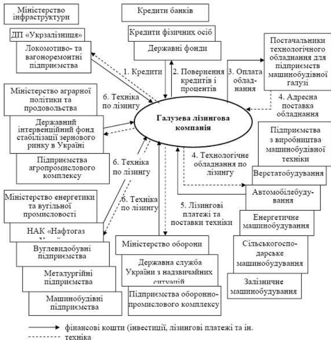
Рис. 1. Модель фінансових і матеріальних потоків при залученні до системи лізингу державних і недержавних інвесторів, виробників і споживачів машинобудівного обладнання й техніки

Підприємства-монополії та державні відомства забезпечують замовлення на нову техніку, а також стабільне повернення лізингових платежів при поставці техніки. У пропонуваній схемі регулююча роль держави полягає у визначенні інвестиційної складової в тарифах і цінах на товари й послуги підприємств, в яких представлені інтереси держави, координації розвитку монополій відповідно до їхньої програми розвитку й можливостей промисловості, у регулюванні рівня інфляції, експортно-імпортних умов тощо.