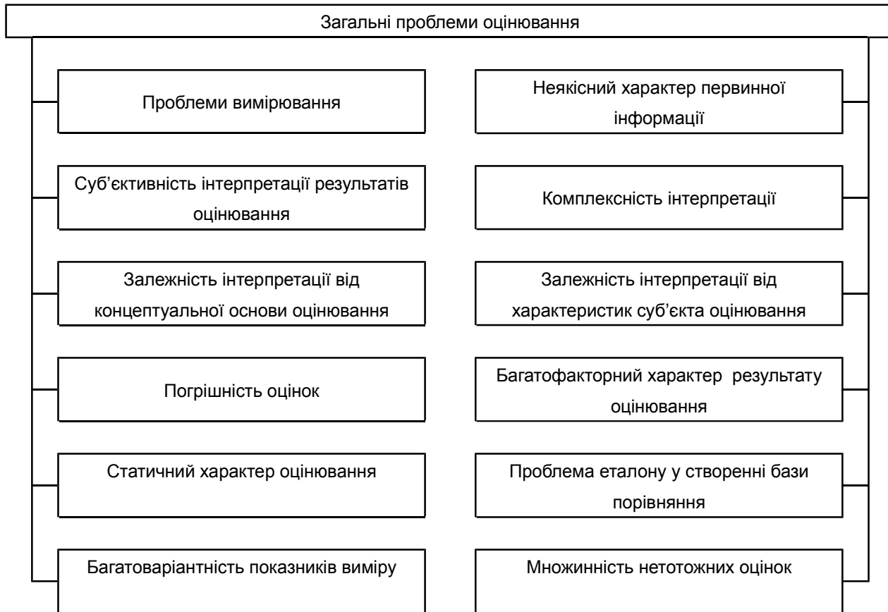
Рис. 1. Загальні проблеми оцінювання як наукової області

Щодо найактуальніших та найгостріших проблем оцінювання загального характеру, які значною мірою впливають на оцінювання (процес) та якість оцінок (результат) в економічній безпекології мікрорівня, слід зазначити таке.