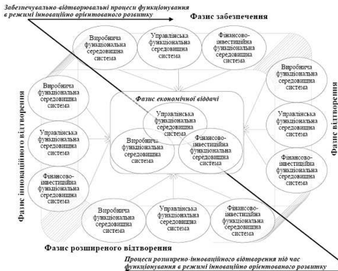
Рис. 3. Структура фазисів функціонування підприємства в режимі інноваційно орієнтованого розвитку

6. Функціонування інноваційно орієнтованого підприємства в режимі інноваційно орієнтованого розвитку відбувається за вертикальною структурою одночасного перебування функціональних середовищних систем у чотирьох фазах – забезпечення, відтворення, розширеного відтворення, інноваційного відтворення (рис.3).