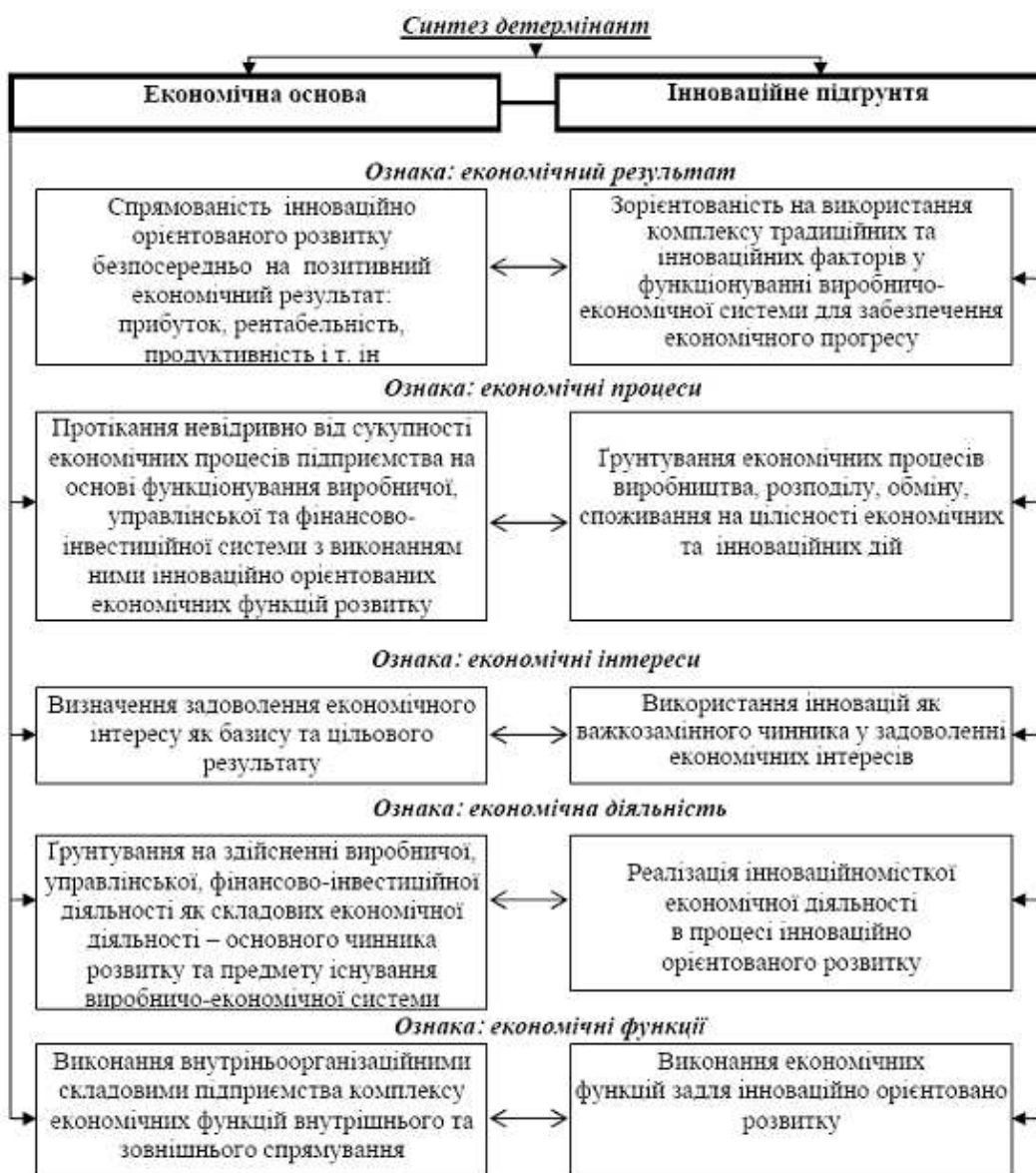
Рис. 2. Синтез детермінант економічної основи та інноваційного підґрунтя функціонування інноваційно орієнтованого підприємства в режимі розвитку

Джерело: складено автором за врахуванням продовження дослідження [7]