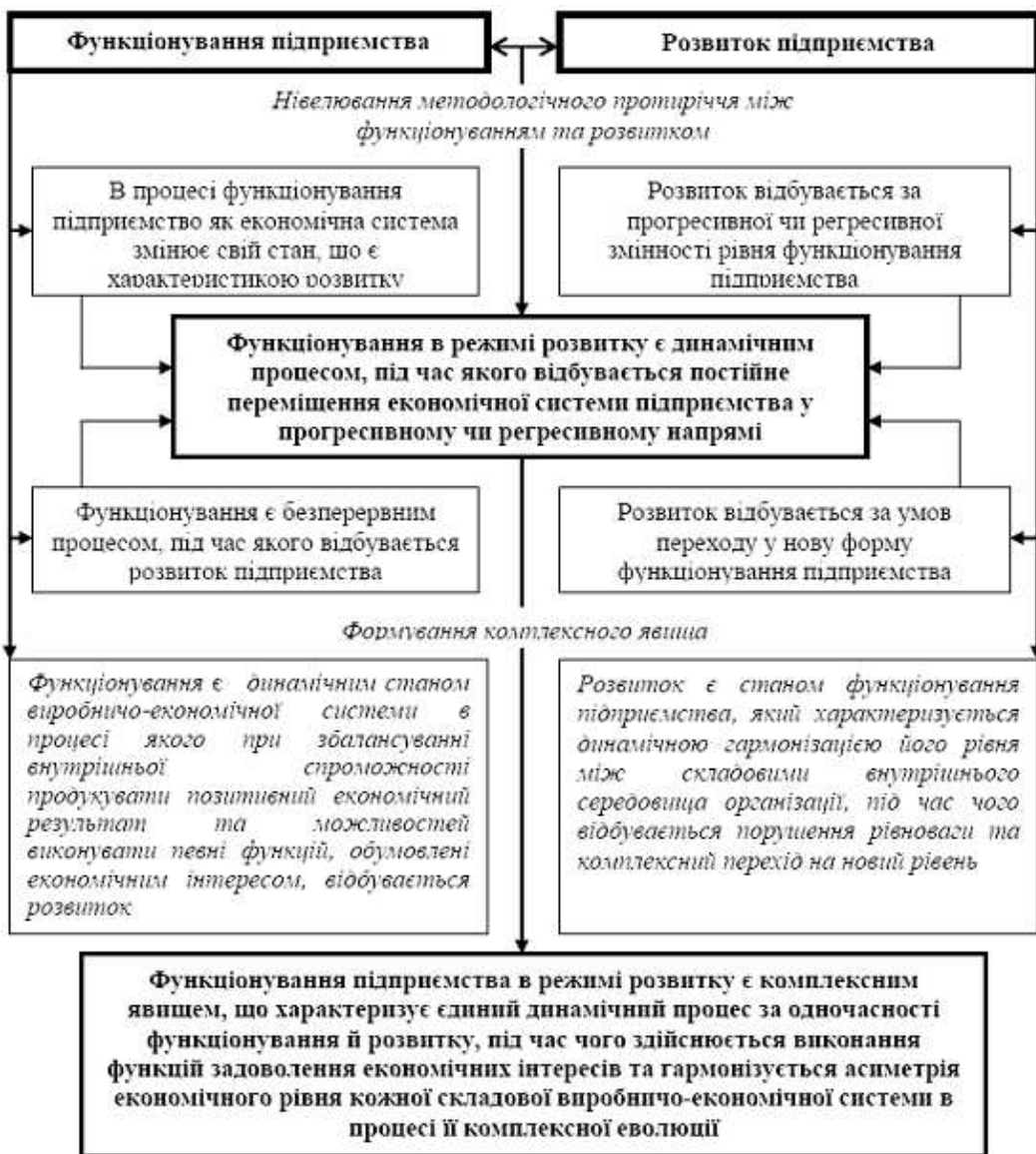
Рис. 1. Елементи обґрунтування комплексного явища – функціонування підприємства в режимі розвитку