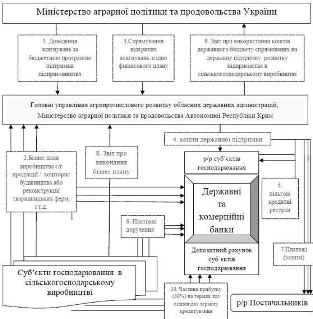
Рис. 1. Організаційна схема здійснення прямої бюджетної та небюджетної підтримки підприємництва в сільськогосподарському виробництві.