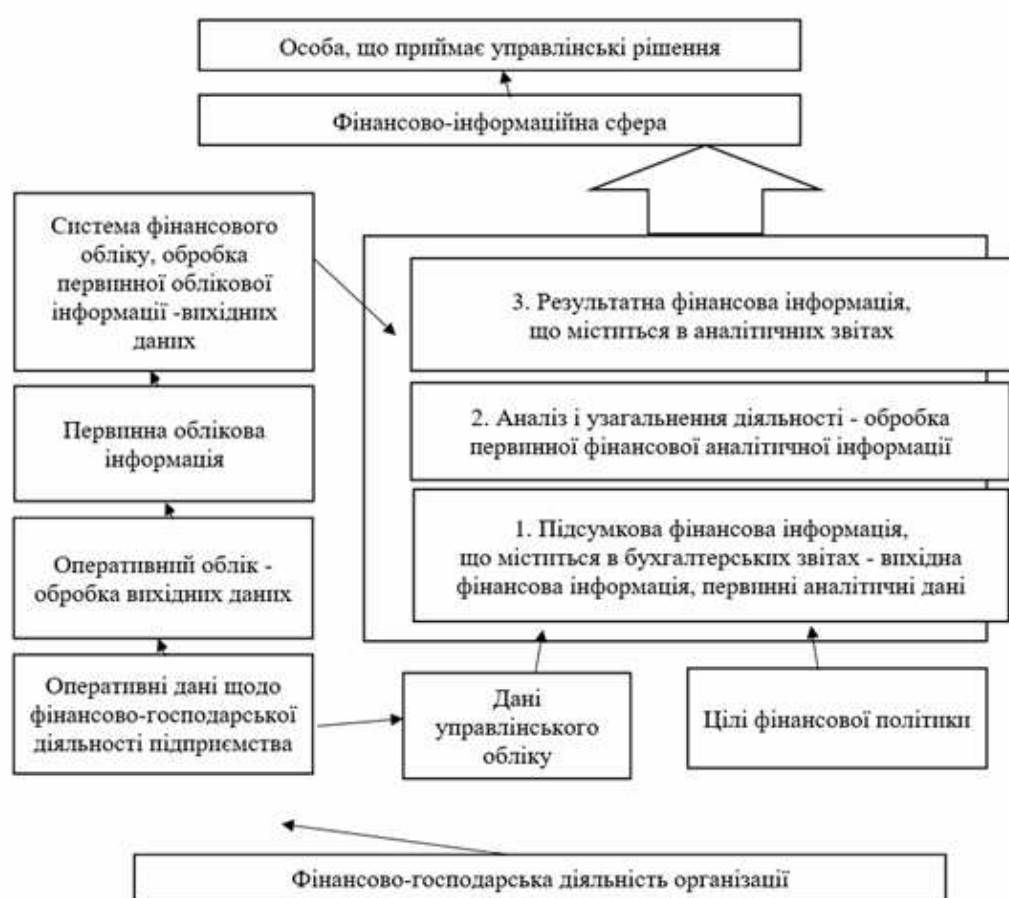
Рис. 1. Процес генерування фінансової інформації для цілей розробки і реалізації фінансової політики