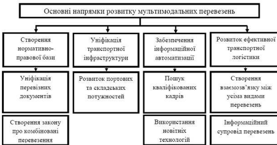
Рис. 1. Напрями розвитку мультимодальних перевезень

Для подолання існуючих проблем можна запропонувати таку низку заходів, яка представлена на рис 1.