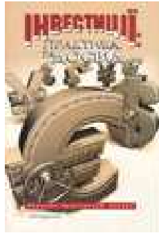
Журнал «Інвестиції: практика та досвід»