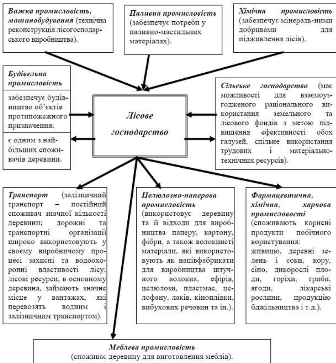
Рис. 1. Взаємозв'язок лісового господарства з іншими секторами економіки

Для їх вирішення між лісогосподарською системою та іншими підсистемами мають бути налагоджені відповідні функціональні зв'язки. На основі результатів досліджень узагальнено зв'язки лісового господарства з іншими секторами економіки (рис. 1).