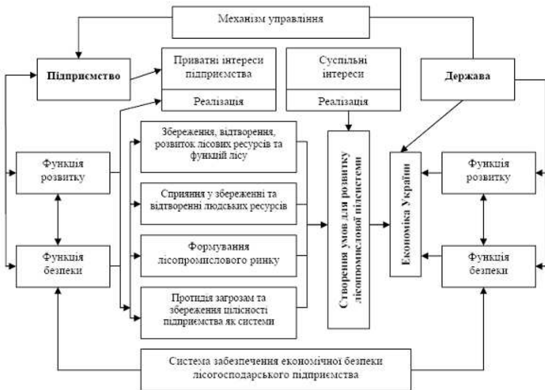
Рис. 3. Вплив діяльності лісогосподарських підприємств на економіку і економічну безпеку України*

Отже, державні лісогосподарські підприємства, як суб'єкти господарювання, реалізуючи функцію розвитку відіграють базисну роль у соціально-економічних відносинах. Проте вона погіршується в наслідок їх дестабілізації, руйнування різними загрозами. У зв'язку з цим, державні лісогосподарські підприємства мають бути під захистом держави, тобто бути об'єктом системи економічної безпеки держави. Крім цього, вони також мають бути активними суб'єктами забезпечення власної економічної безпеки. Основний зміст зазначеного положення відображено на рис. 3