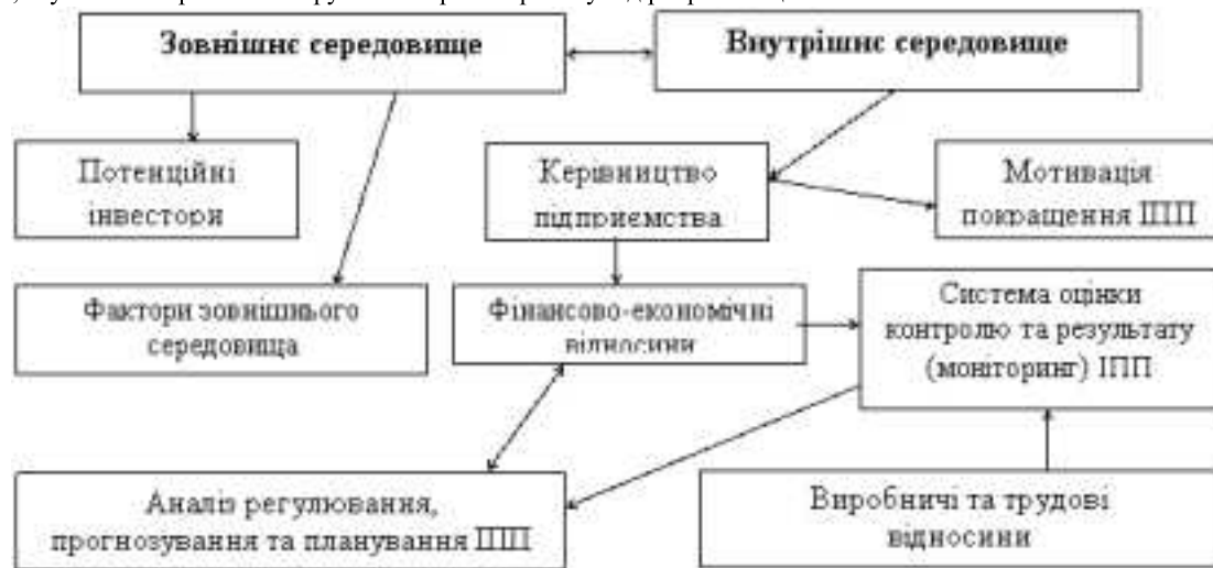
Рис. 3. Процес управління інвестиційною привабливістю промислового підприємства [5]

Корпоративне управління характеризується такими показниками: фінансова прозорість і розкриття інформації; частка державної власності в статутному капіталі товариства; частка акцій у вільному обігу на вторинному ринку цінних паперів; дотримання прав дрібних акціонерів з управління підприємством; розмір винагороди членам ради директорів; ступінь захищеності прав акціонерів; ступінь імовірності банкрутства та рівень ризику від реорганізації компанії та інше.