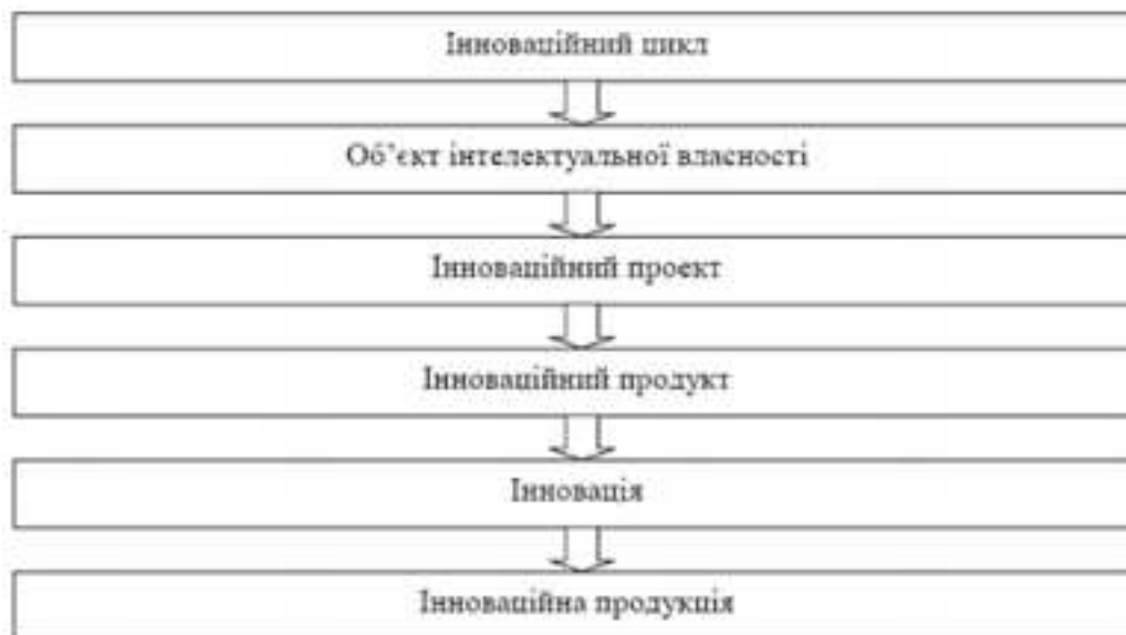
Рис. 1. Складові інноваційного циклу складено автором на основі [6, с. 41]

Спираючись на наведене можемо надати визначення терміну «інноваційний продукт»: «Інноваційний продукт – це результат НДДКР, що виконується в межах відповідного інноваційного проекту і є фазою трансформації відповідним чином оформленого об'єкту інтелектуальної власності у інноваційну продукцію та підґрунтям розробки інновацій і виробництва інноваційної продукції у межах інноваційного циклу, а також вперше представлений на ринку країни або має значні переваги перед іншими аналогічними продуктами».