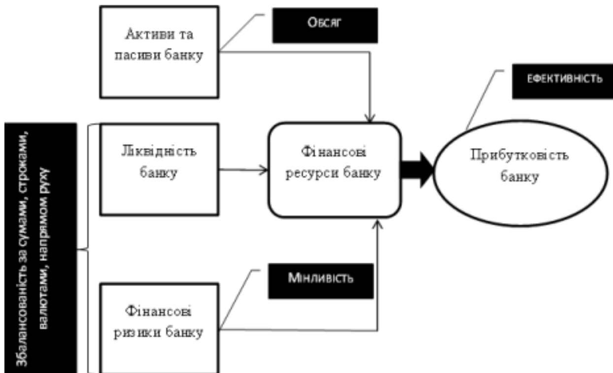
Рисунок 1. Зв'язки між ключовими властивостями фінансових ресурсів та фундаментальними постулатами управління фінансами банку

Оскільки поняття «фінанси банків» слід характеризувати як форму економічних відносин, нами запропоновано структурувати економічні відносини за типами відносин та контрагентів з поділом на внутрішні та зовнішні.