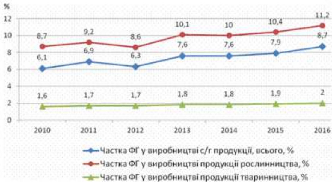
Рис. 1. Питома вага фермерських господарств у виробництві сільськогосподарської продукції*