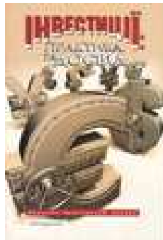
Журнал «Інвестиції: практика та досвід»