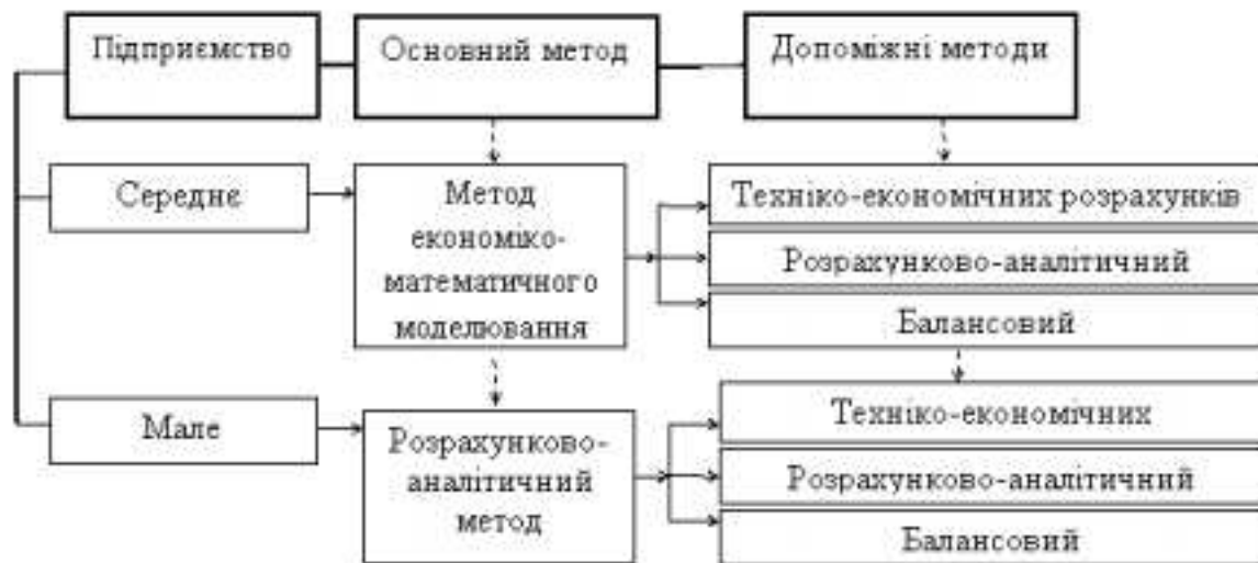
Рис. 1. Диференціація методів фінансового планування залежно від розміру підприємства

Так, згідно рис.1. найбільш прийнятним підходом до розроблення поточного фінансового плану великого підприємства торгівлі є метод економіко-математичного моделювання. Кадрове, інформаційне, програмне забезпечення та прагнення до вдосконалення управління фінансами на такому підприємстві створює можливості для застосування цього методу у плануванні найважливіших фінансових показників його розвитку, встановленні зв'язків між ними, а в якості допоміжних, які використовуються для локальних планових розрахунків застосовувати методи техніко-економічних розрахунків, розрахунково-аналітичний та балансовий [4, с.9].