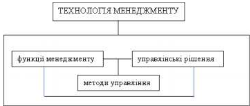
Рис. 2. Основні складові технології менеджменту [5]

У Західному менеджменті виділяють три основні групи технологій: технології планування (planning) управлінських рішень; технології реалізації (structuring) управлінських рішень; технології зміни (adaptable) структури організації.