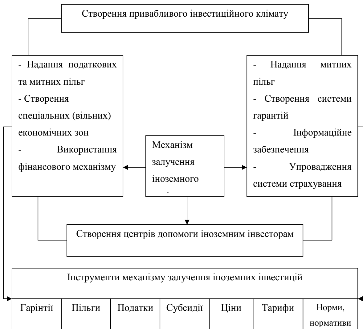
Рисунок 3. Складові механізму залучення іноземних інвестицій [Авторська розробка]

Механізм залучення іноземних інвестицій повинен охоплювати стратегічні, проміжні та поточні цілі, перелік форм, методів, об'єктів та інструментів впливу на основні параметри регіонального та як слідство державного економічного розвитку. Вказані складові механізму залучення іноземних інвестицій наведено на рисунку 3.