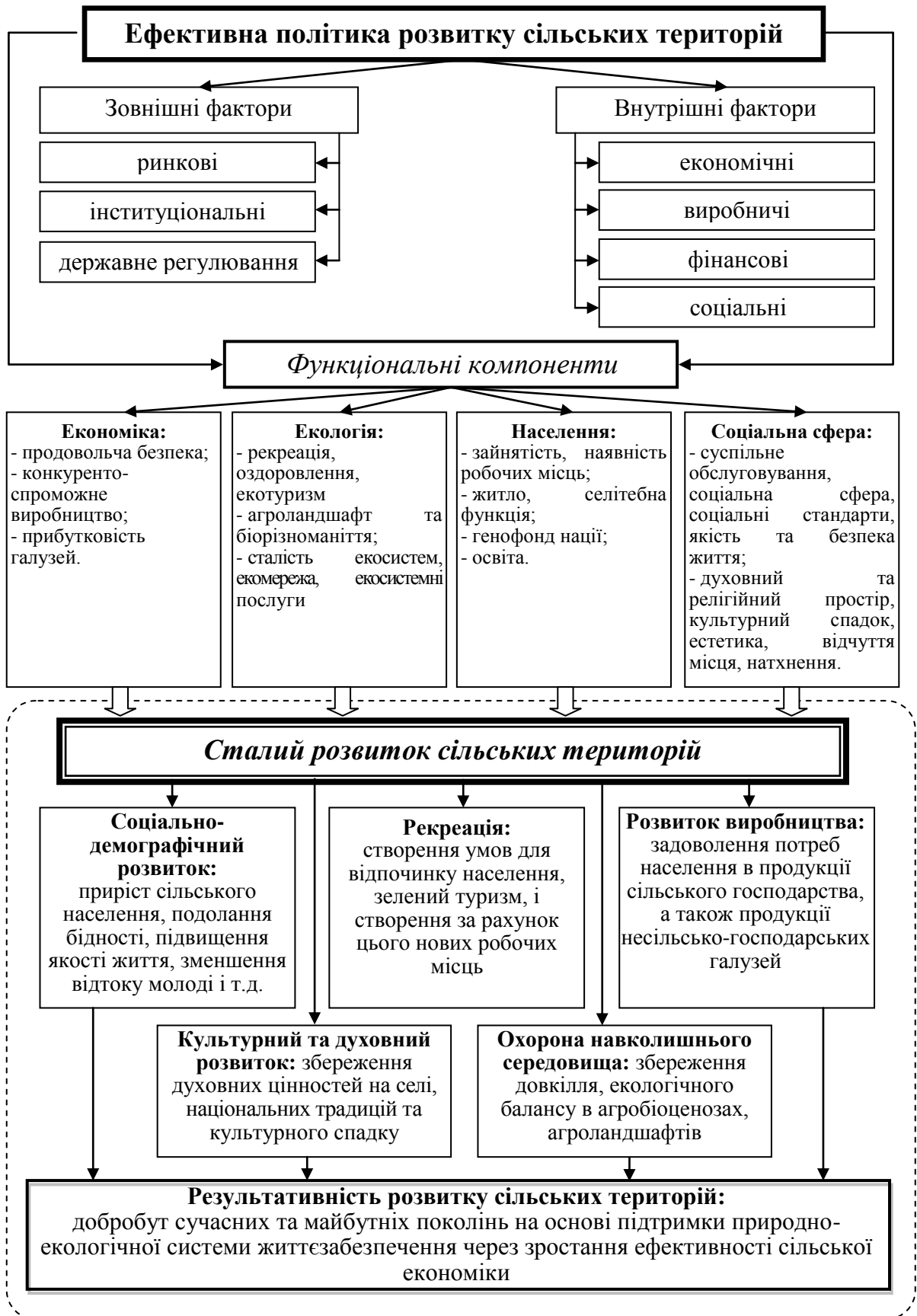
Рис. 1. Структура концептуальної моделі розвитку сільських територій