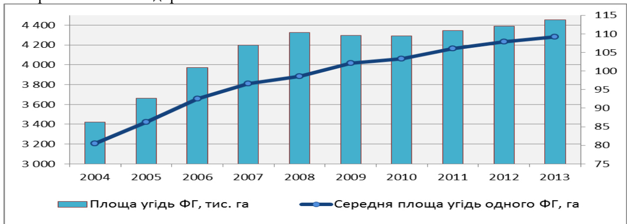
Рис. 2. Динаміка землекористування фермерських господарств

У процентному вираженні протягом більш ніж десяти років вказана структура є майже незмінною. Тим не менш, існує стійка тенденція до скорочення кількості виробничих кооперативів та державних підприємств. Фермерські господарства є найбільш поширеною формою господарювання у вітчизняному сільському господарстві, що свідчить про відносну інвестиційну привабливість даної форми господарювання для нових підприємців. З іншого боку, фермери обробляють лише близько 1/5 наявних сільськогосподарських угідь. Це є свідченням того, що такі підприємці обмежені в капітальних засобах виробництва і джерелах розширення власних підприємств.