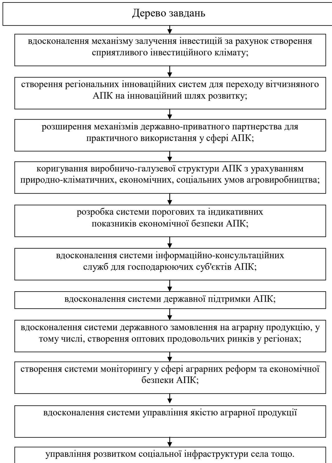
Рис. 1. “Дерево завдань” побудови економічного механізму комплексної системи забезпечення регіональної економічної безпеки аграрної галузі

Стратегічною ціллю побудови комплексної системи регіональної економічної безпеки аграрної галузі є створення необхідних умов для розвитку підприємств аграрного сектору економіки та забезпечення економічної стійкості та соціально-економічної стабільності розвитку територій. Для досягнення даної цілі необхідно