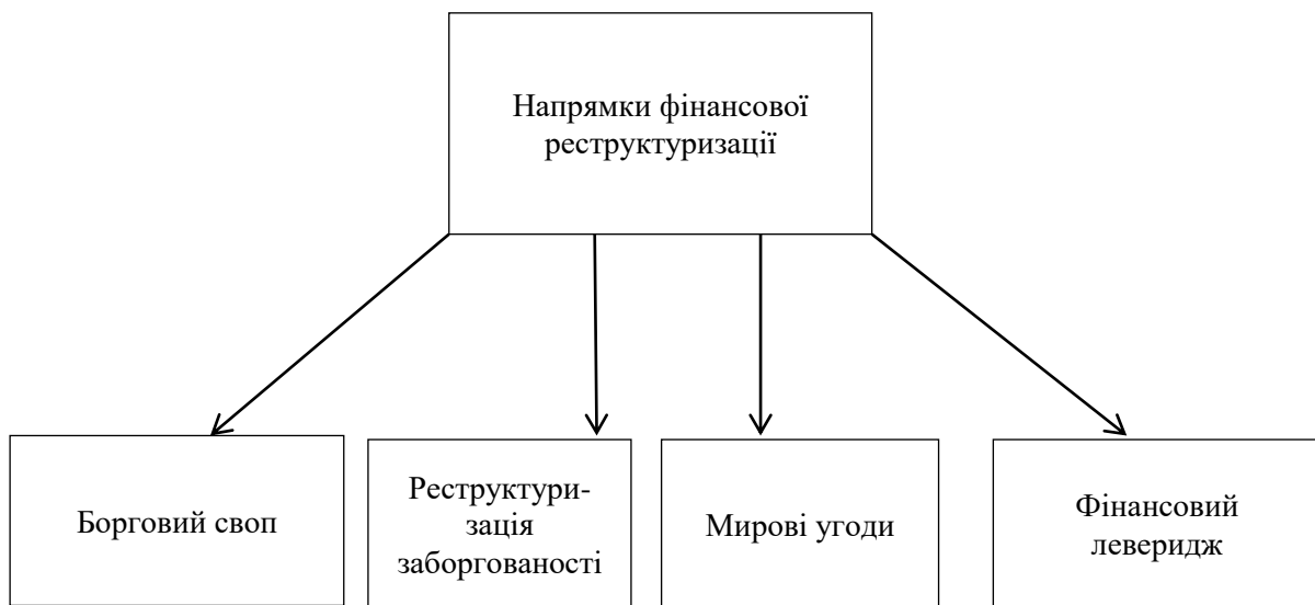
Рис. 2. Напрямки фінансової реструктуризації [2]

На даний час в умовах подорожчання енергоносіїв проведення виробничої реструктуризації на переробних підприємствах АПК доцільно створювати побічні виробництва, орієнтовані на виробництво альтернативних джерел енергії (на спиртових заводах – біогазових установок, на цукрових – виробництва біоетанолу з барди), що дасть можливість покращити стан енергетичної безпеки.