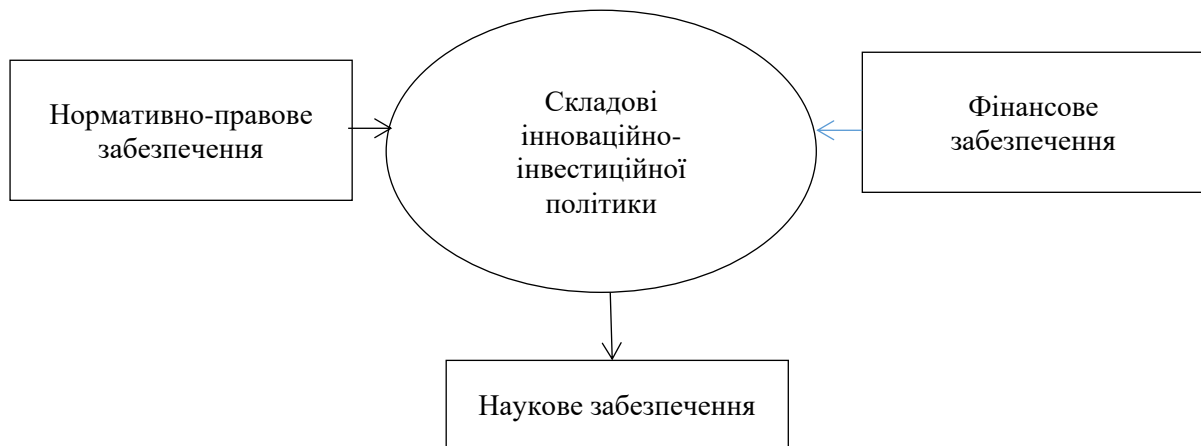
Рис. 1. Основні складові формування інноваційно-інвестиційної політики [7]

Для усунення недоліків потрібно розробити ефективний механізм державної інноваційно-інвестиційної політики здійснення відповідних процесів в аграрній сфері економіки. Державна інноваційно-інвестиційна політика включає в себе багато складових. На наш погляд, можна виділити три основних складових, на яких ґрунтуються основні засади формування інноваційно-інвестиційної політики (рис. 1) [7].