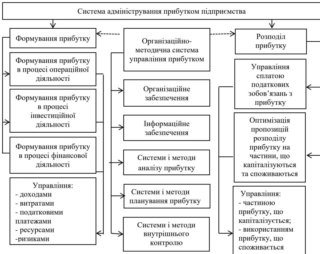
Рис. 1. Структурно-логічна схема здійснення процесу адміністрування прибутком підприємства