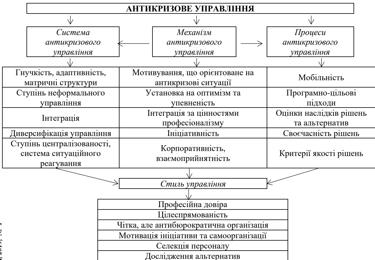
Рис. 1. Антикризове управління: вимоги до системи, механізму та процесу управління