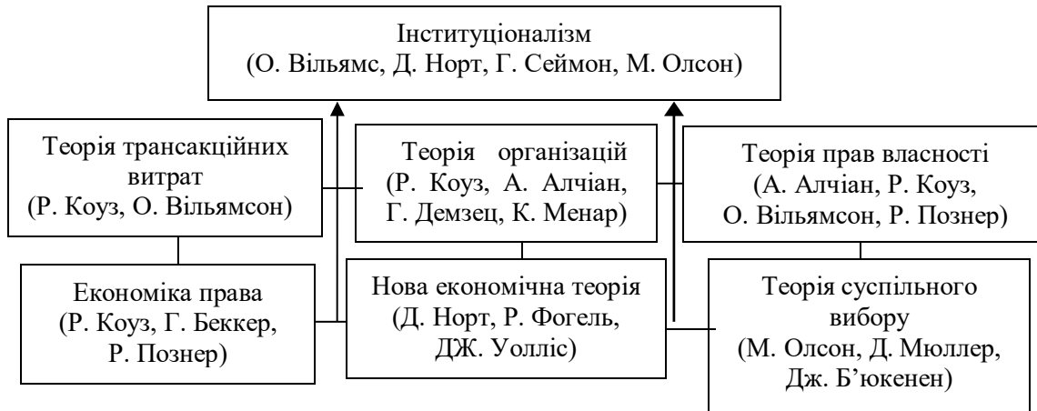
Рис. 2. Концептуальний зміст інституціоналізму як економічної теорії та парадигми суспільного розвитку

розвитку вимагає позитивних змін у поведінці як самих селянських господарств, так і системи органів місцевої влади, установ і організацій, які так чи інакше впливають на формування сприятливого інституційного середовища.