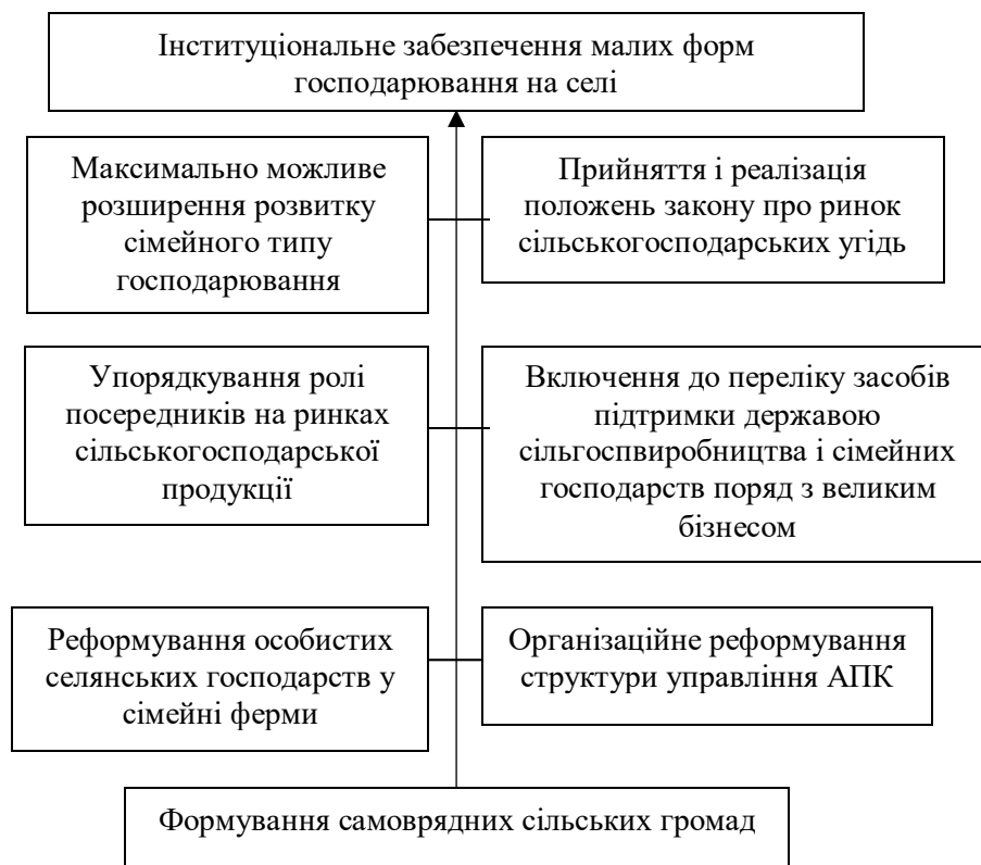
Рис. 4. Напрями та зміст інституційного розвитку малих форм господарювання на селі